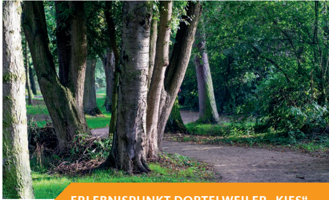
ERLEBNISPUNKT DORTELWEILER „KIES“

Das Dortelweiler „Kies“ entlang der Kleingärten und des Niddabogens zeichnet sich durch seinen parkähnlichen Charakter aus. Durch den Ausbau des Nidda Radwegs in Dortelweil war es möglich, jeweils einen eigenen Weg für den Rad- und für den Fußverkehr zu bauen. Der neu angelegte Fußweg schlängelt sich in Höhe der Kleingärten zwischen den Bäumen hindurch und überquert mit einer naturnahen Steinschüttung einen Bach.