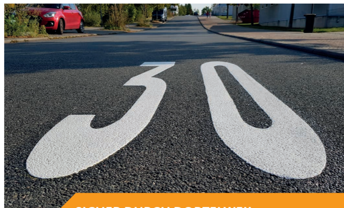
SICHER DURCH DORTELWEIL

In enger Zusammenarbeit mit der Deutschen Marktgilde konnte in Dorteilweil das Wochenmarktangebot weiter ausgebaut und dadurch der Dorteilweiler Platz deutlich belebt werden: Nun ist nicht nur mittwochs, sondern auch samstags Wochenmarkt in Dorteilweil. Obst und Gemüse, Backwaren in Bio-Qualität, Feinkost und weitere Leckereien sind eine sinnvolle Ergänzung des Angebots des Brunnencenters. Des Weiteren bietet der Wochenmarkt an Samstagen einen idealen Treffpunkt für die Dorteilweiler, die bei einem Glas Wein ins Gespräch kommen wollen.