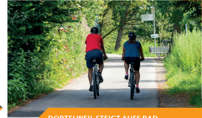
DORTELWEIL STEIGT AUFS RAD

Eine weitere große Renaturierung auf der östlichen Niddaseite von der neuen Radbrücke bis zum Dottenfelderhof ist in Planung: Hier soll künftig die Nidda in einem großen Mäander fließen und sich Buhnen und Buchten, Galleriewaldabschnitte oder Zugänge zur Nidda abwechseln.