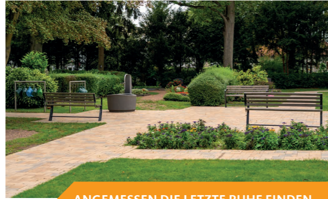
ANGEMESSEN DIE LETZTE RUHE FINDEN

Zusätzlich führte die Sperrung des Weges im Niddabogen für den Radverkehr zu einer Beruhigung der Situation für Spaziergänger.