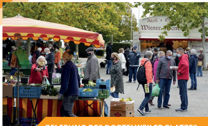
BELEBUNG DES DORTELWEILER PLATZES